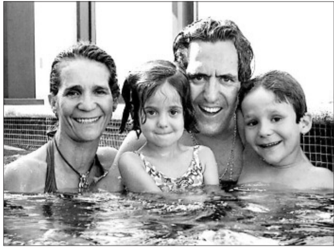
Felicitaciones navideñas de los duques de Palma de Mallorca, los príncipes de Asturias y los duques de Lugo.